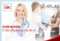
Cartão Saúde Club Ldc