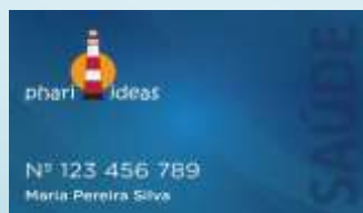
Phari Ideas - Saúde

Estes são os cartões geridos pela Wda-ADE em Março de 2015