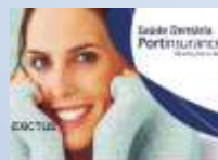
Portinsurance Saúde Dentária EXICTUS