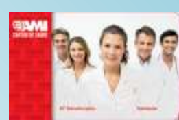
AMI – Assistência Médica Internacional