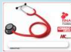
Cartão Saúde Correio da Manhã VIP