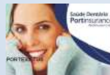
Portinsurance Saúde Dentária PORTEXTUS

Estes são os cartões geridos pela Wda-ADE em Março de 2015