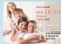
Plano Walk'in Plus