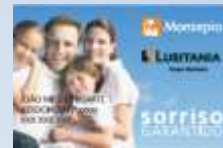
Montepio Geral Sorriso Garantido