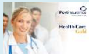
Portinsurance Health Care Gold