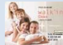
Plano Walk'in Plus Dentário