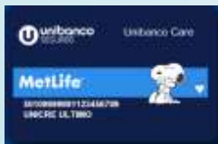
METLIFE Unibanco Care