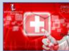
Scragaseguros Plano Base