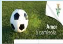
GDMealhada Amor à camisola