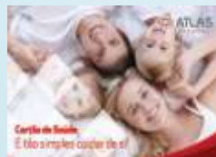
Cartão Saúde ATLAS