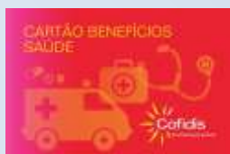
Plano de Saúde Cofidis