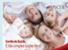
Cartão Saúde APICER