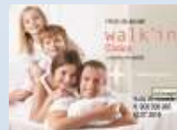
Plano Walk'in Dental