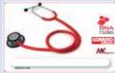
Cartão Saúde Correio da Manhã BASE