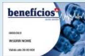
Benefícios Mais Saúde