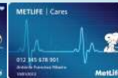
METLIFE Cares – Hospital + Santander Consumer