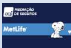
MetLife ACP Mediação de Seguros