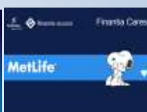
MetLife Finantia Cares