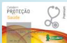
Cetelem Protecção Saúde Premium