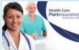
Portinsurance Health Care