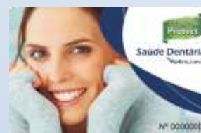
Portinsurance Saúde Dentária Tantum Protect

Estes são os cartões geridos pela Wda-ADE em Março de 2015