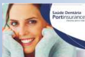
Portinsurance Saúde Dentária Low Cost