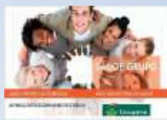
ServiMED Groupama Saúde Grupo