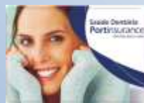
Portinsurance Saúde Dentária