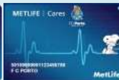
METLIFE Cares – FC Porto