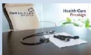
Portinsurance Health Care Prestige