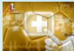
sbragaseguros Plano Premium